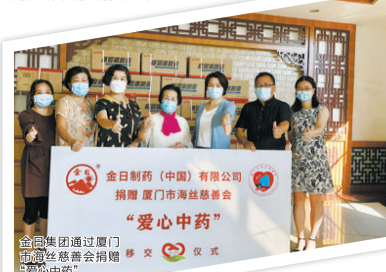
金日集团通过厦门市海丝慈善会捐赠“爱心中药”。