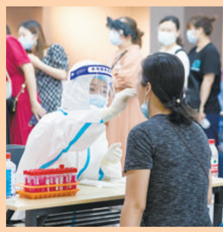
厦门艾德生物医药科技股份有限公司协助开展核酸检测工作。