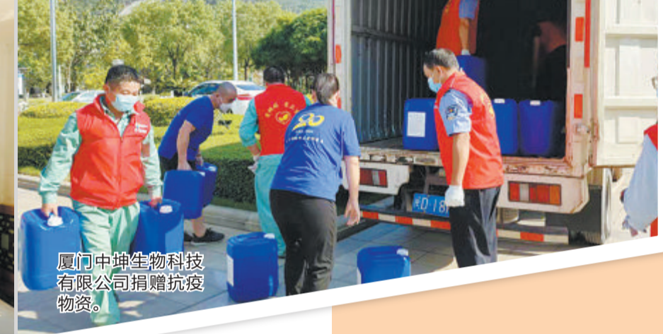
厦门中坤生物科技有限公司捐赠抗疫物资。