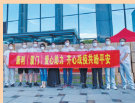
康利集团捐赠的抗疫物资,第一时间交付同安抗疫一线。