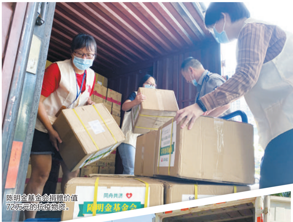
陈明金基金会捐赠价值72万元的抗疫物资。

上下同欲者胜,同舟共济者赢。近日,厦门新增的新冠肺炎患者已连续数日降为个位数,曙光在望,但这也是关键的时刻,丝毫不能放松。请相信,在我们的共同努力下,厦门将会恢复往日的活力。亲爱的港澳台同胞和海外侨胞,让我们再次加油,共同期待重逢的时刻早日来临!